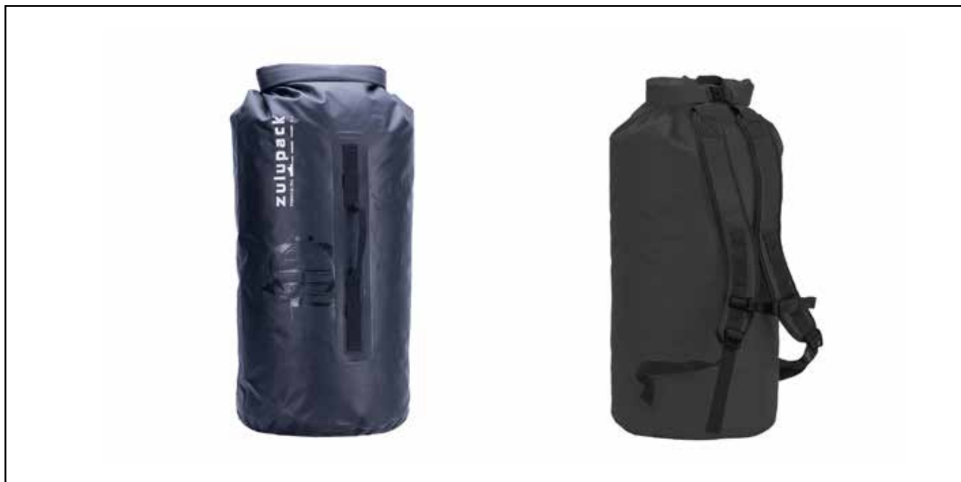
Sac Zulupack Tube 45 Noir